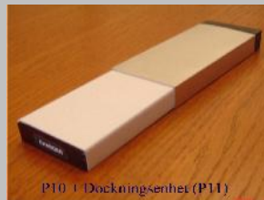
P10 + Dockningsenhet (P11)

Vårt fokus är sensorlösningar för vardaglig trygghet där många marknadsledande teknikföretag kan höja värdet i sitt produktutbud. Följande sidor visar några exempel på ESS -teknikens användning i en utföringsform där ett modulärt automatlarm har en central enhet (P10) och fem dockningsenheter (P11-P15).