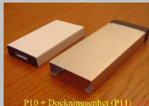
P10 + Dockningsenhet (P11)